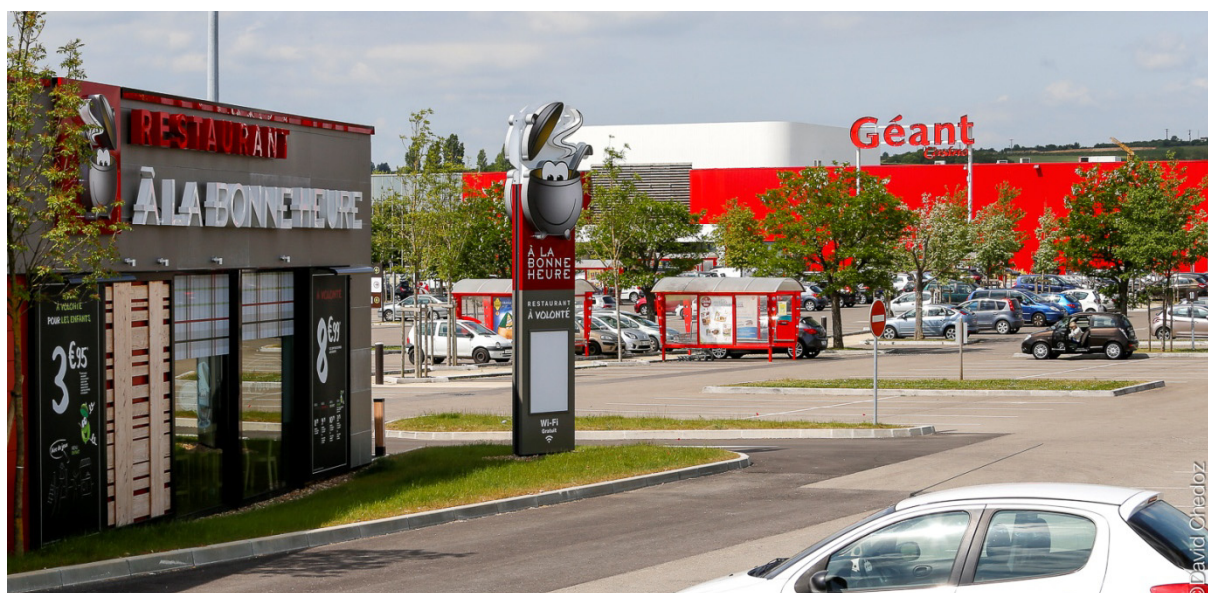
GÉANT CASINO, Fontaine-lès-Dijon, France

Le résultat opérationnel courant s'élève à 1 446 M€ (contre 2 231 M€ en 2014), affecté notamment par les derniers effets de baisses de prix chez Géant et Leader Price en France et par une inflation des coûts au Brésil dans un contexte de faible croissance du chiffre d'affaires.