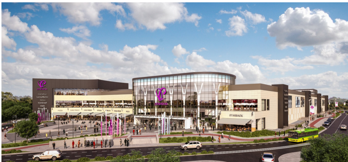
POSNANIA, Poznan, Pologne