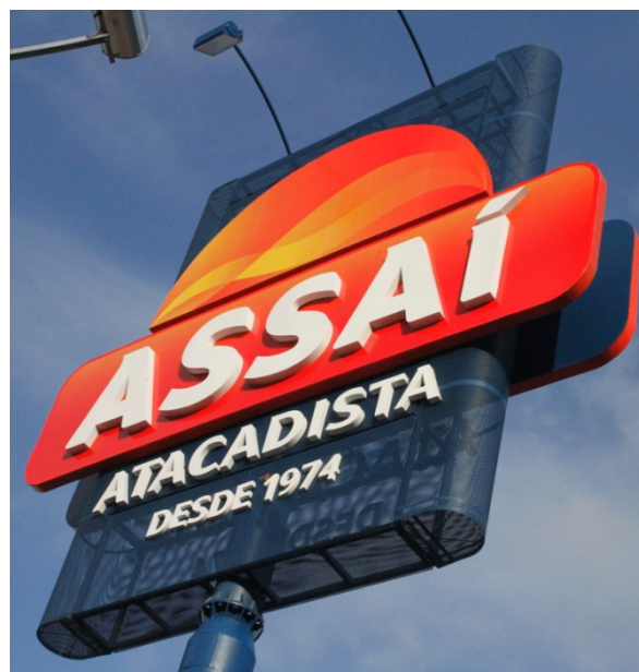
| ASSAÍ, São Paulo, Brésil

Éxito (hors Brésil) accélère sa croissance avec des ventes organiques en hausse de 4,0% en 2015 hors essence et calendrier.