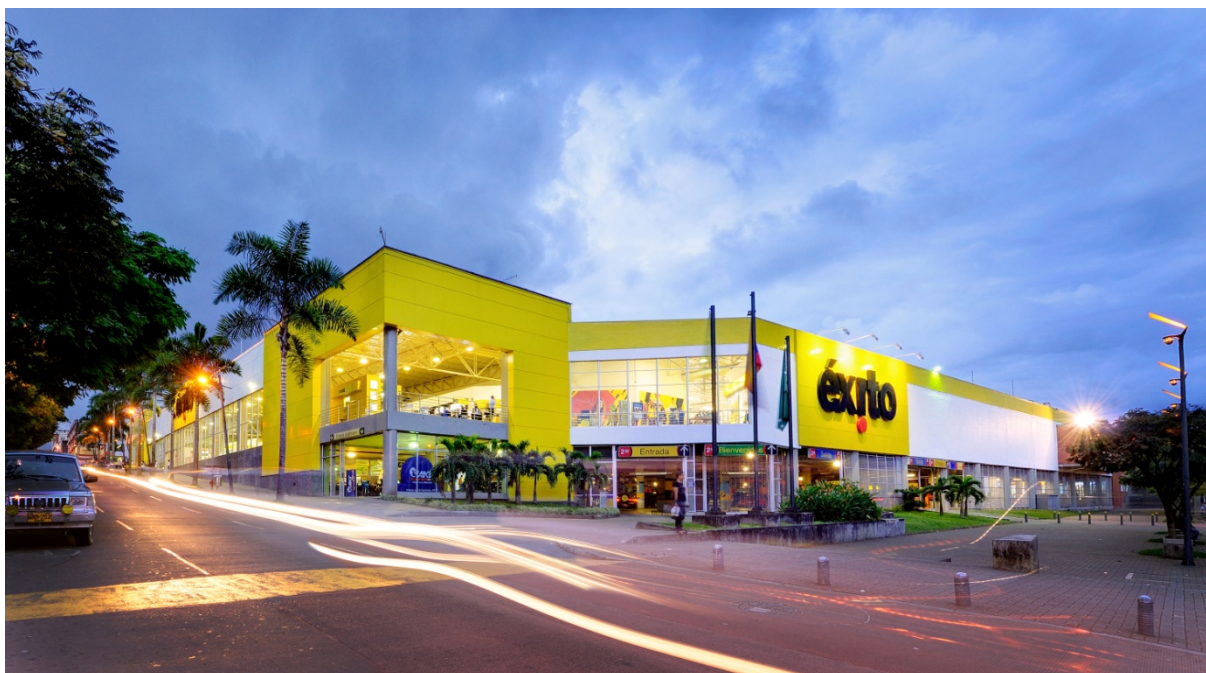
EXITO, Medellín, Colombie

Le résultat opérationnel courant du segment Latam Retail se maintient à un niveau élevé en dépit de l'effet de l'inflation des coûts et de l'effet change, dans un contexte de faible croissance du chiffre d'affaires. La marge se maintient à un niveau élevé grâce à de nombreux plans d'actions sur la marge et les coûts. Les performances de l'Argentine et l'Uruguay sont très soutenues.