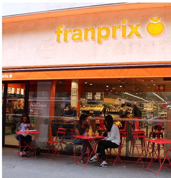
| FRANPRIX, Paris, France